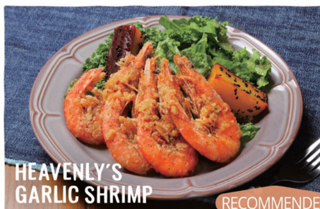
HEAVENLY'S GARLIC SHRIMP

10種類の具材とケールをふんだんに使用した、waikiki本店で大人気のHEAVENLY'Sスタイルサラダ。