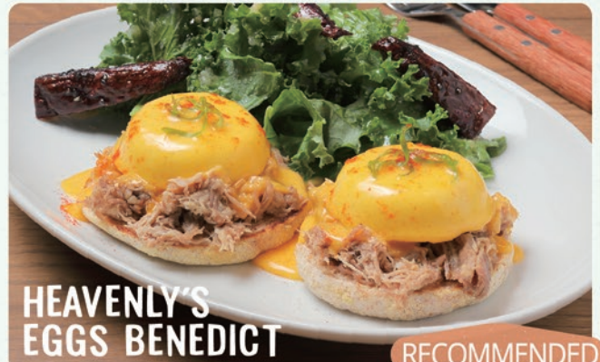
HEAVENLY'S EGGS BENEDICT RECOMMENDED

ヘブンリーズ・ロコモコ 1636 (税込1800) 国産の黒毛和牛を100%使用。 十穀米とオーガニック野菜、オーガニックレンズ豆&ブラックビーンズをふんだんに使用した、ヘブンリー・オリジナルロコモコ。