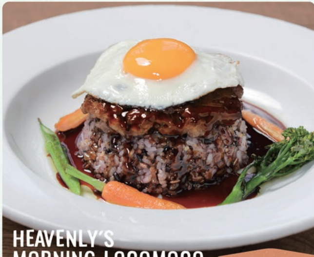
HEAVENLY'S MORNING LOCOMOCO RECOMMENDED

ヘブンリーズ・ロコモコ 1636 (税込1800) 国産の黒毛和牛を100%使用。 十穀米とオーガニック野菜、オーガニックレンズ豆&ブラックビーンズをふんだんに使用した、ヘブンリー・オリジナルロコモコ。