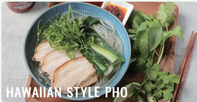
HAWAIIAN STYLE PHO

フレッシュ野菜をふんだんに使用したやさしい味の ハワイアンフォーで、1日を気持ちよくスタート!! all 1527 (税込1680)