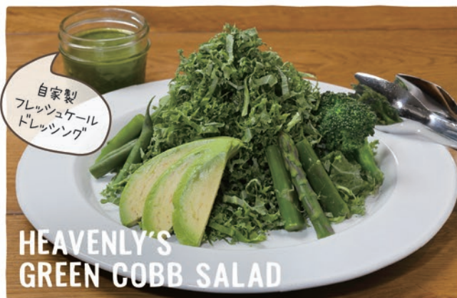
HEAVENLY'S GREEN COBB SALAD

バッファロー・チキンウィング 5P 800 (税込880) Buffalo Chicken Wings ●BBQソース / ●HOTチリソース BBQ Sauce / Spicy Hot Sauce