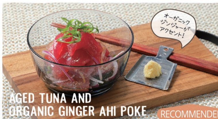
AGED TUNA AND ORGANIC GINGER AHI POKE